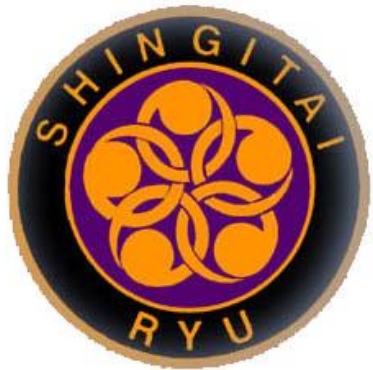
Das ursprüngliche Symbol des Shingitai